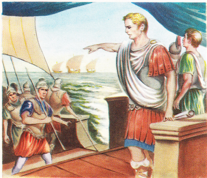
En s'appuyant sur le parti populaire Pompée obtint le commandement d'une flotte puissante, avec laquelle il mit fin aux menées des pirates en Méditerranée.

Ce sont les restes des bandes de Spartacus qui, elles, étaient demeurées dans le Nord de l'Italie, que Pompée trouva sur sa route. En les battant il put se vanter d'avoir mis un terme à la troisième Guerre Servile. (La première avait éclaté à Enna, en Sicile, en 133, et avait eu pour chef l'esclave Ennius; la seconde, qui dura de 104 à 101, se livra également