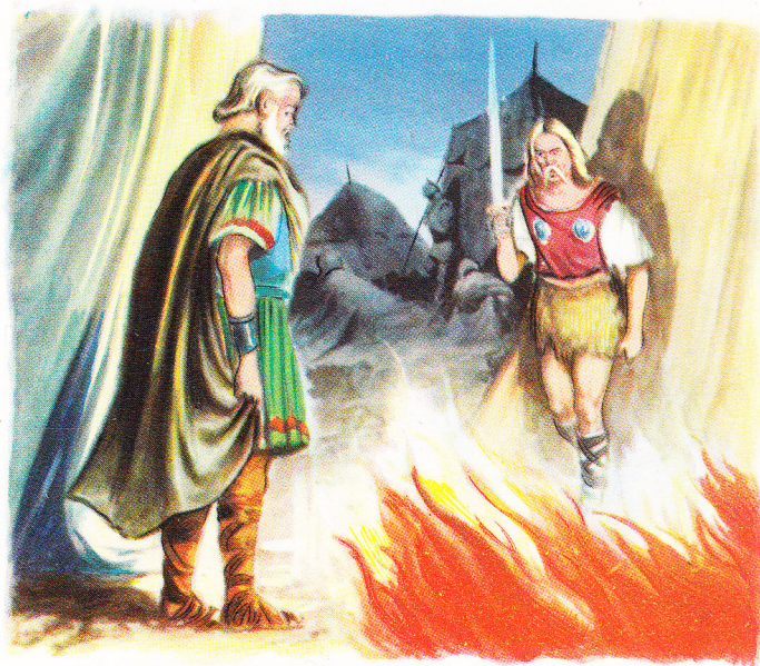
Il reprit ensuite la guerre contre Mithridate, Roi du Pont, qu'il battit près de l'Euphrate. Le roi se réfugia en Colchide, mais abandonné de ses derniers partisans il se fit tuer par un Gaulois en 63 av. J.-C.

Puis, il obtint d'être envoyé contre Mithridate qui, battu par Sylla, avait repris les hostilités (74) et tenait en échec les légions. Pompée arriva en Asie Mineure en 66, battit Mithridate près de l'Euphrate, lui tua dix mille hommes en une nuit, le contraignit à se réfugier en Colchide où il se fit tuer par un Gaulois, pour mourir libre.