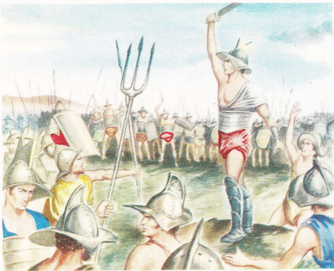
Spartacus, gladiateur à Capoue, décida ses compagnons à se révolter contre Rome. Des milliers d'esclaves, considérés comme les « choses du maître » se rallièrent à lui.