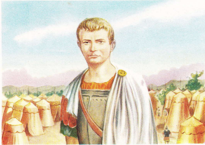
Cneius Pompeius (Le Grand Pompée), naquit en l'an 106 av. J.-C. et mourut en l'an 48.