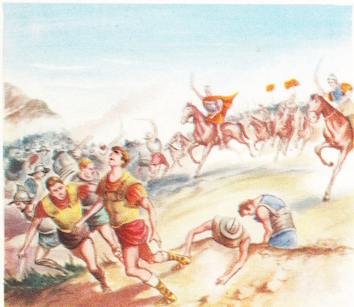
Les Romains envoyèrent contre Spartacus, le général Licinius Crassus qui les battit. Spartacus trouva la mort à la bataille de Silare (71 av. J.-C.).