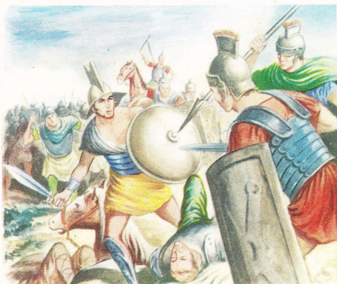
Les rebelles s'étaient répandus dans la Campanie, où ils ravageaient les terres et pillaient les bourgades. Ils parvinrent à plusieurs reprises à vaincre les légions romaines.